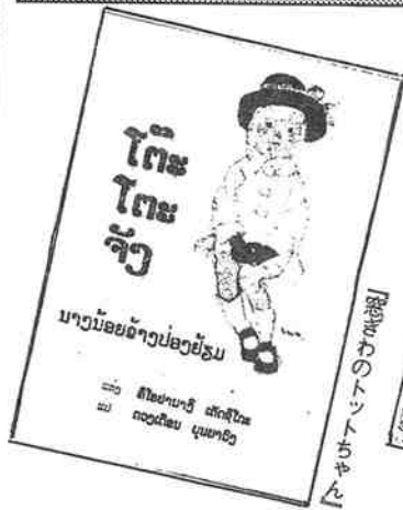
「窓ぎわのトットちゃん」