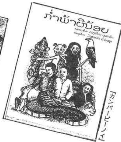
「カンバーピーノイ」